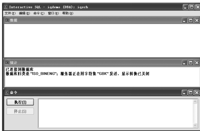
图 2-3: Windows 上的 dbisqlc 窗口

在启动 dbisqlc 之后，将打开 Interactive SQL Classic 窗口。它分成三个子窗口。最顶端是“数据”子窗口，第二个是“统计信息”子窗口，在屏幕底部是“命令”子窗口，如图 2-3 所示。